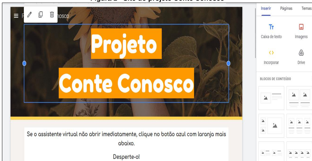
Figura 1 - Site do projeto Conte Conosco

A seguir, mostraremos algumas imagens internas dos dois sites que criamos usando o Google Sites .