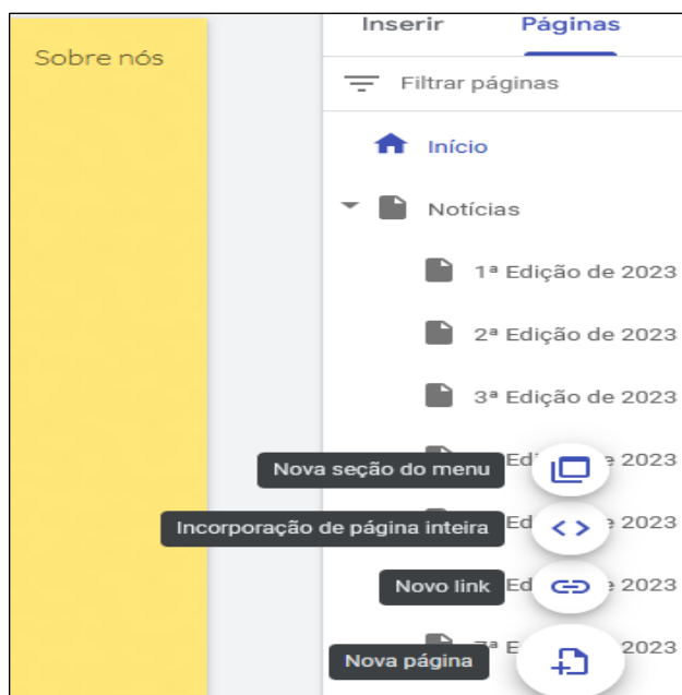
Figura 4 - Interface do site

Para incluir novas informações, basta clicar no ícone de +, na parte inferior do lado direito (Figura 4).