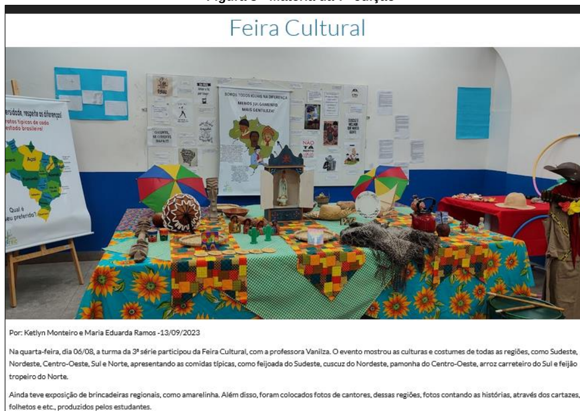
Figura 3 - Matéria da 7ª edição

A seguir (Figura 3), uma das matérias da 7ª edição: