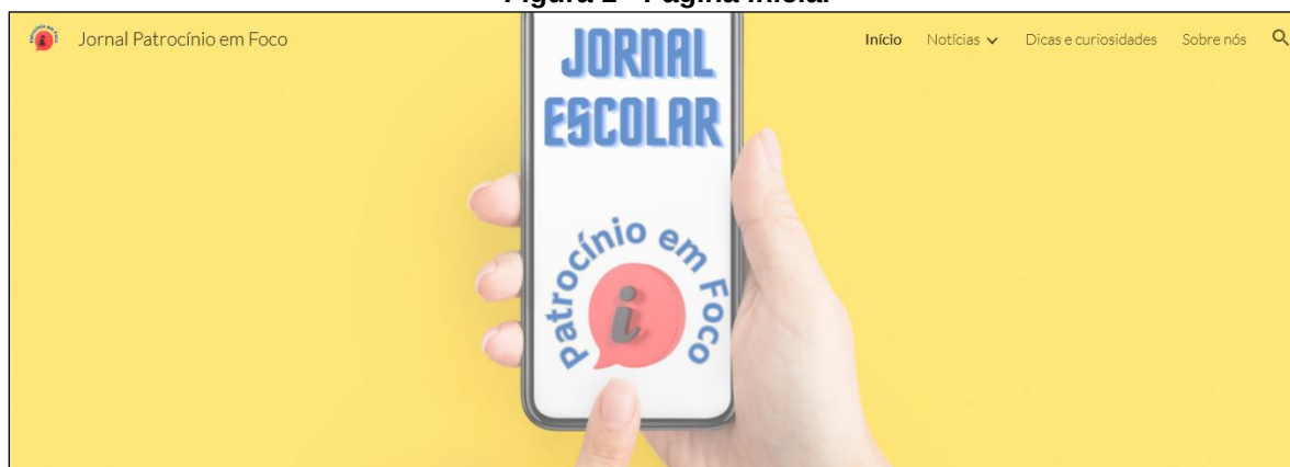
Figura 1 - Página inicial

Ao entrar no jornal temos as categorias de Notícias , Dicas e curiosidades e Sobre nós , onde falamos um pouco sobre o intuito do nosso projeto, quem somos nós e os nomes de todos os(as) estudantes participantes (Figura 1 e Figura 2).