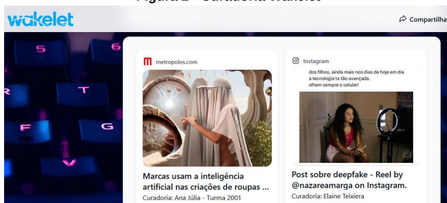
Figura 2 - Curadoria Wakelet