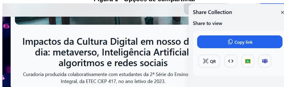
Figura 1 - Opções de compartilhar