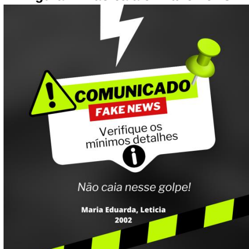
Figura 1- Não caia em fake news