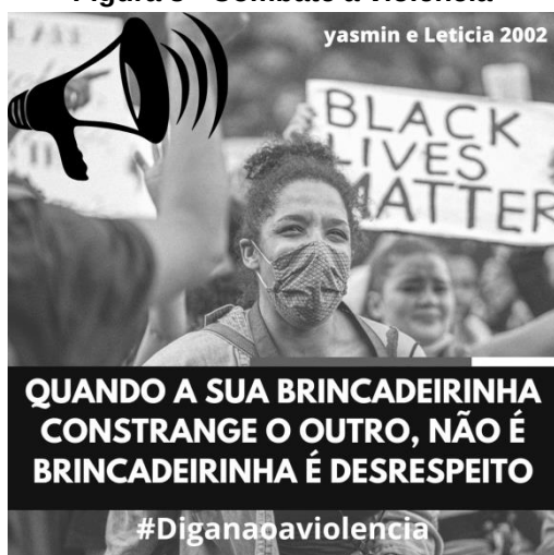
Figura 3 - Combate à violência