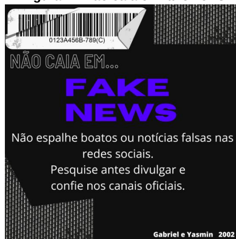
Figura 2 - Não caia em fake news